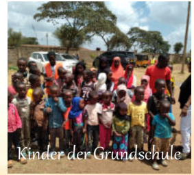
Kinder der Grundschule