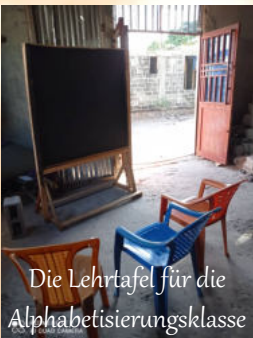
Die Lehrtafel für die Alphabetisierungsklasse

🌀 : 15 Kinder, die in der Grund- und Sekundarschule eingeschult sind. 7 Teenie-Mütter in Alphabetisierungs- und Nähklassen