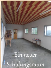
Ein neuer Schulungsraum