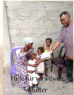
Hilfe für verwitwete Mütter

📅 : Der Verein möchte von Beginn an das Ziel der Eigenfinanzierung durch Wasserbohrungen anstreben, um Nähmaschinen beschaffen, ein Haus für die Aufnahme von Waisen und Straßenkinder erwerben oder bauen und den Schulbesuch dieser Kinder finanzieren zu können.